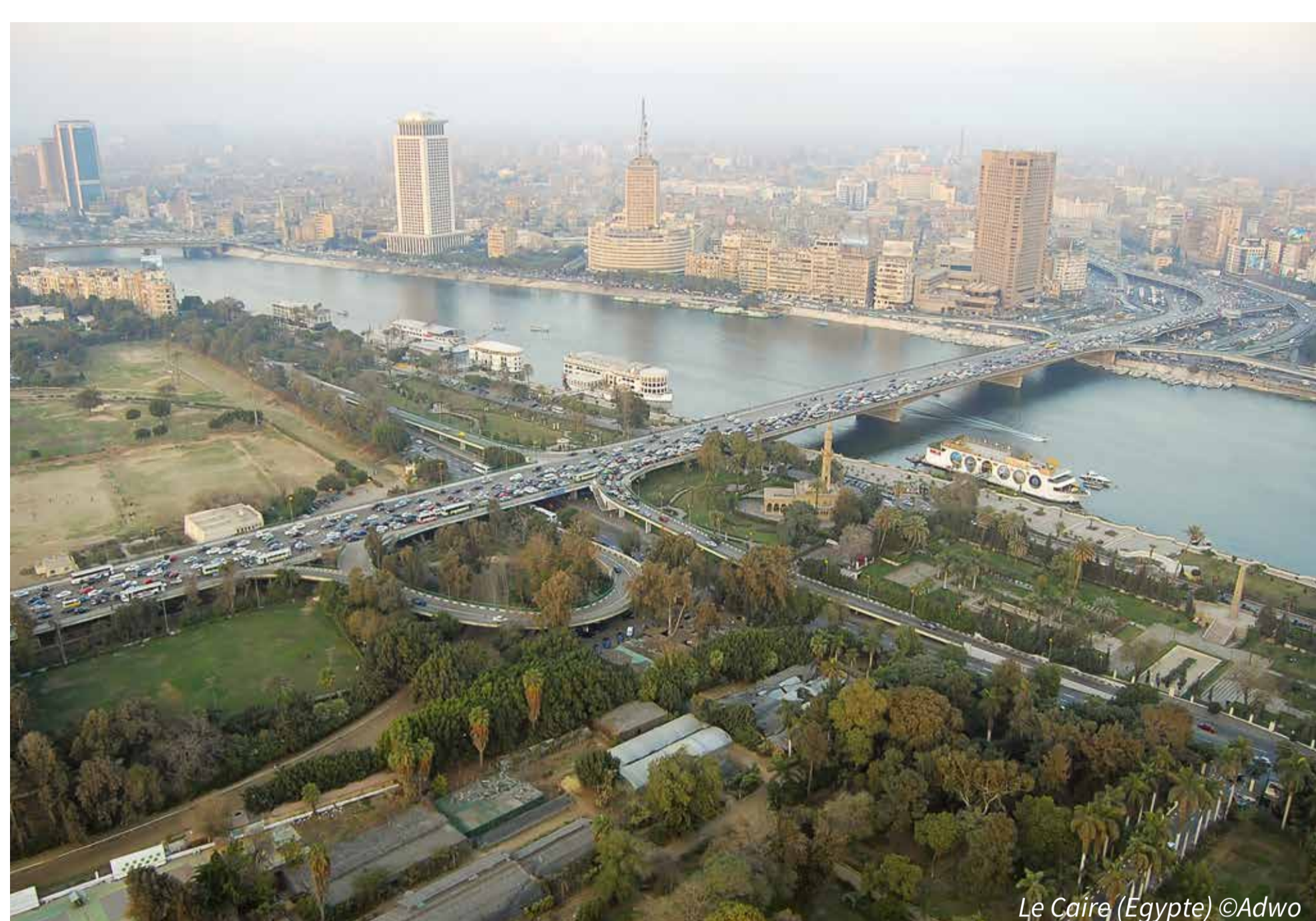
Le Caire (Égypte)

Le bassin méditerranéen est un « point chaud » du changement climatique, avec d'ici à la fin du siècle :