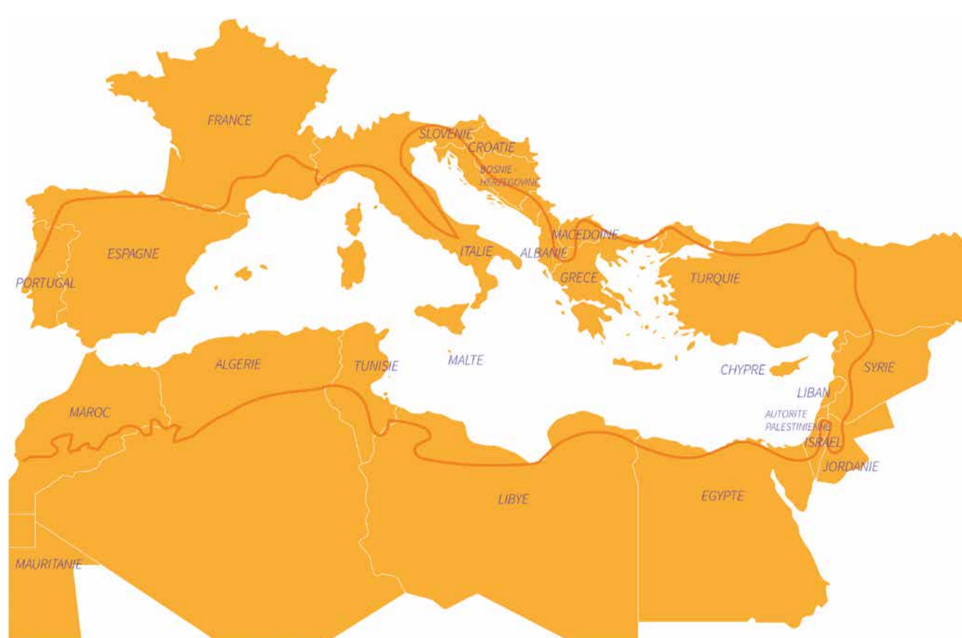
Limite bioclimatique de la région méditerranéenne : —