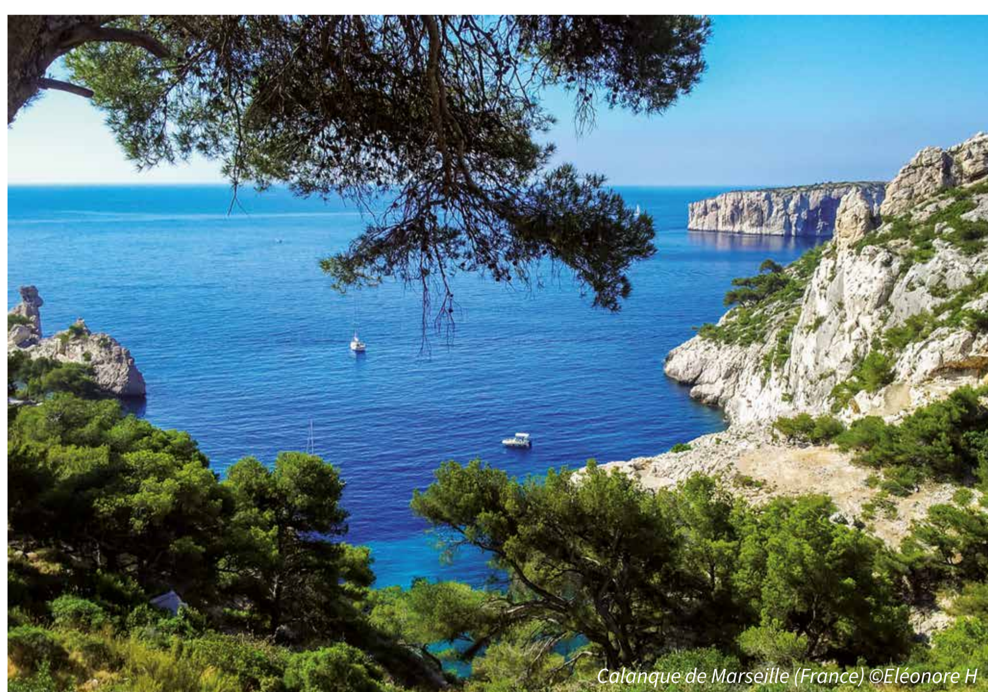
Calanque de Marseille (France)

Les candidatures sont ouvertes du 25 mai au 16 septembre 2016.